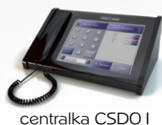
centralka CSDO I

Wszystkie urządzenia wykonane są z wysokiej jakości podzespołów i materiałów zapewniających długotrwałą i bezproblemową eksploatację.